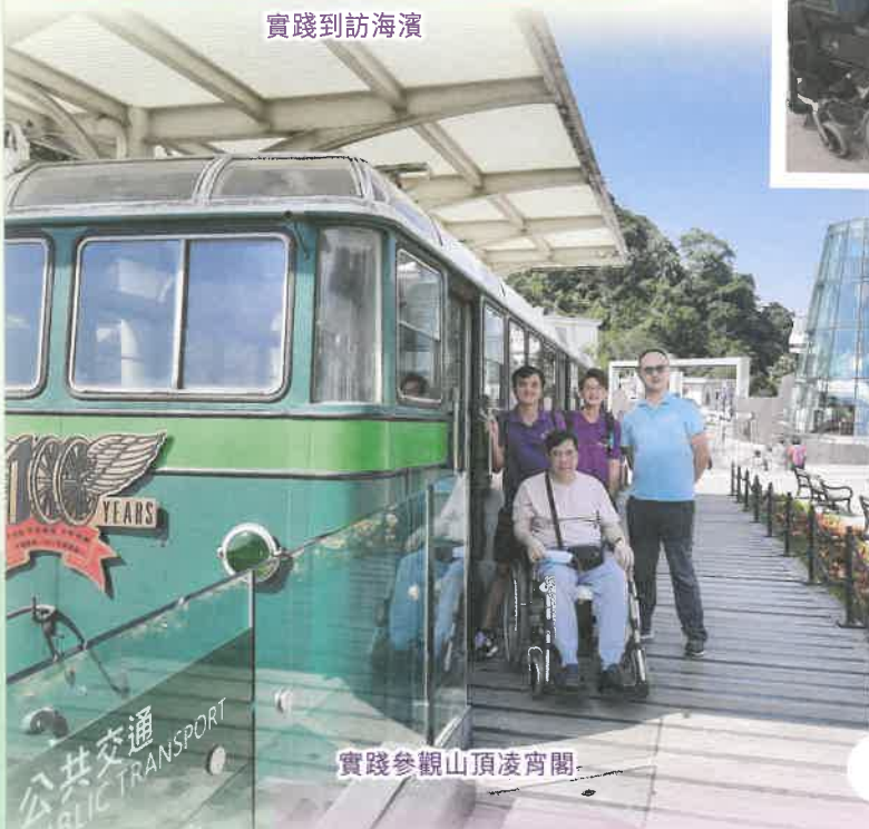
實踐參觀山頂凌霄閣