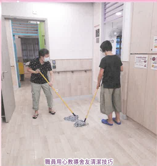
職員用心教導舍友清潔技巧

宿舍的工作看似微細刻板，教導舍友恆常清洗、摺疊衣物、清潔打掃，以及在情緒和行為上支援舍友，但這亦正正是舍友需要學習及成長的地方。