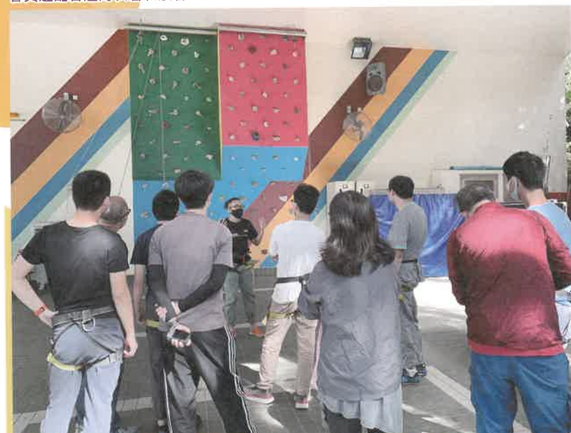
定期舉行親子活動，以提供機會予會員和家人互動，共享親子時間