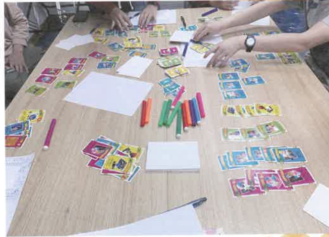
透過桌遊認識自己對將來的想法，以及規劃人生