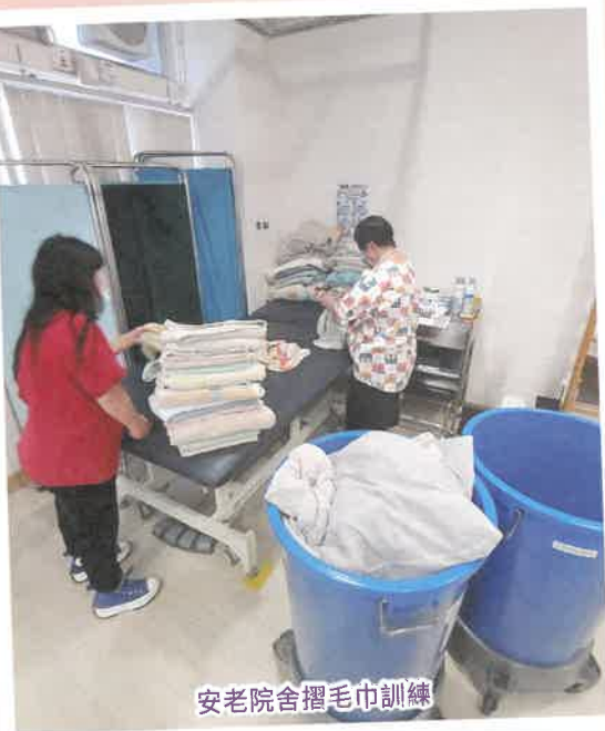
安老院舍摺毛巾訓練

承擔意味著我們要為服務使用者的需要負責；委身意味著我們要把服務使用者的需要放在首位。除了中心為本的工場訓練，我們還會與坊間機構合作，開拓實習機會，提供可賺取津貼的工作技能訓練，配合就業團隊多元化的支援，讓殘疾人士的職業訓練不再局限於桌面包裝形式，還有更多機會與社區接觸，包括訓練乘坐交通工具、善用金錢、培養團隊合作精神，藉此踏上公開就業階梯，為社會發揮所長。