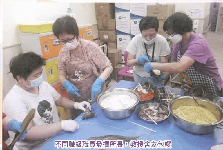
不同職級職員發揮所長，教授舍友包糰