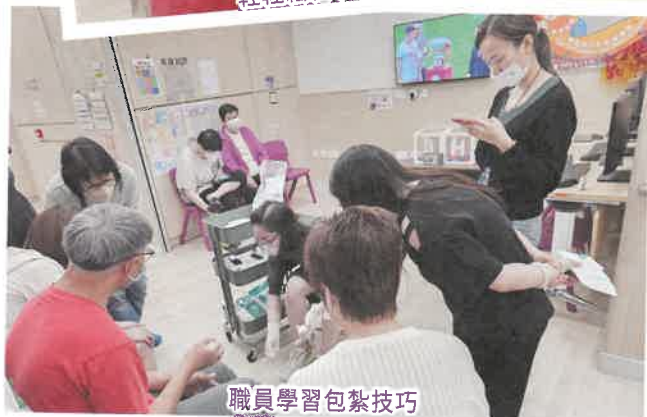
職員學習包紮技巧