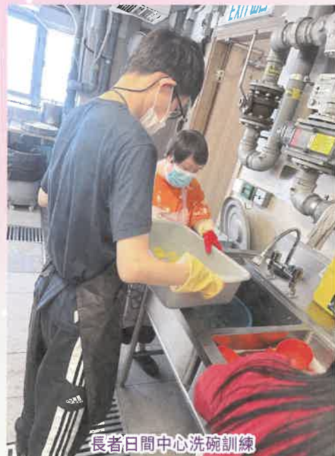
長者日間中心洗碗訓練