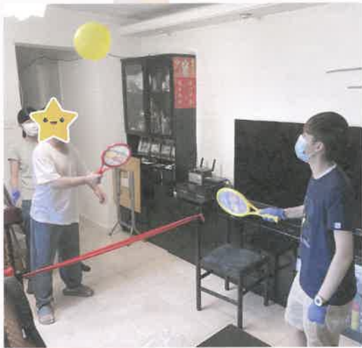
打羽毛球前的前置練習

試著安頓下來，靜心細想，此刻你有什麼夢想？是要事業有成、改變社區，抑或環遊世界？「夢想」一詞雖然感覺宏大，看似遙遠，但指的其實是人的目標與期望。我們相信任何人都可以擁有夢想，不論其背景、個性或環境如何，亦包括生活上需要克服各種限制的殘疾人士，均可以擁有並且追尋夢想。所謂：「一支竹仔會易折彎，幾枝竹一扎斷節難」，服務使用者的熱衷和自我挑戰的態度，配搭服務團隊的經驗和智慧，定能讓石縫綻放生機。在過去一年，喜晴計劃和服務使用者一同成就了各種不同夢想：有人重拾昔日的興趣、有人造訪未曾去過的地方，當中雖有辛酸，但這些成果最能鼓舞人心，亦是助人工作者的重大推動力。