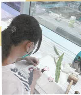
定期舉辦家長小組，透過藝術、手工藝等，以助照顧者從中抒發自己的情緒