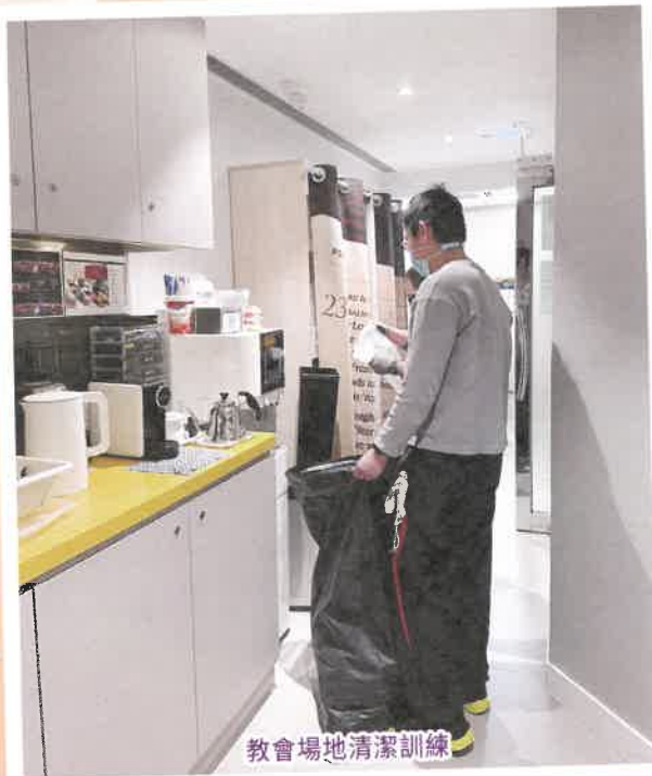
教會場地清潔訓練