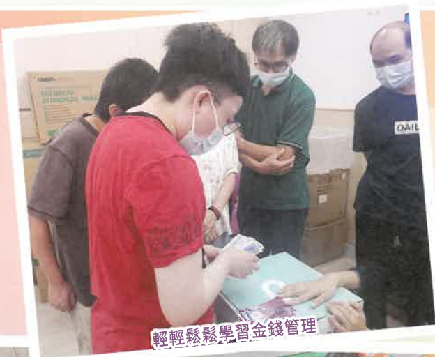
輕輕鬆鬆學習金錢管理

舍友每一次的小進步、每一個滿足的微笑，均是宿舍職員堅持的動力！在未來的日子，悦翠居的職員會繼續懷著謙卑的態度，不斷學習增值自己，實踐「承擔委身」的服務精神，持續提升服務質素！