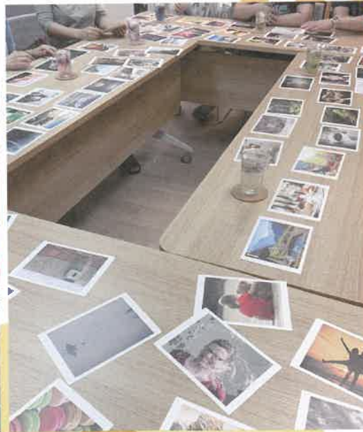
家長工作坊，藉住活動（如紅花卡、沖泡花茶等），讓照顧者思考自己的需要，並試計劃如何回應自己的需要