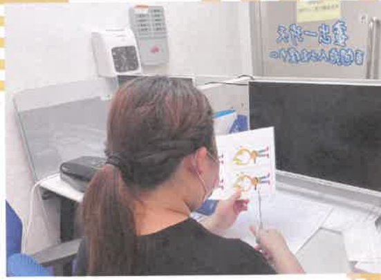
會員到中心進行文職工作實習，且培訓他們的工作技能，定期進行檢討，以助其發展