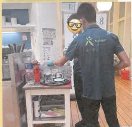
中心與不同企業合作，提供試工、行業體驗活動等，以助會員發掘自己的專長，亦可規劃日後的工作發展

中心於照顧者支援服務中，提供工作坊／小組，讓照顧者多關顧自己的需要，亦協助尋找和調節更合適的方法與子女相處及助其成長。