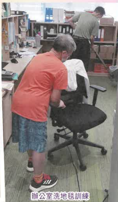
辦公室洗地毯訓練