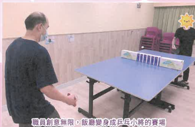
職員創意無限，飯廳變身成乒乓小將的賽場

轉眼間，悦翠居已營運了一年半，在短短的日子裡，舍友融洽相處、烹調及清潔等技巧均有所進步，當中實有賴背後一班默默耕耘的職員。