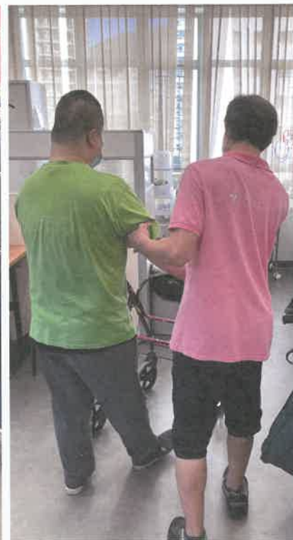
照顧員正輔助會員到指定位置