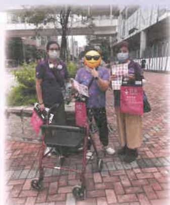
家居照顧員與服務使用者參與機構賣旗活動