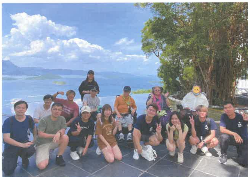
中大新亞書院的合一亭，看見海天一色的美麗風景

在剛剛過去的暑假，中文大學社會服務工作隊的一班同學與牽晴計劃合作，舉辦了一系列的活動，當中包括由我們的服務使用者帶領中大學生們以輪椅體驗方式遊走深水埗；另一節則由學生們帶領服務使用者一探「山城」，大家彼此配搭。一方面學生們能多認識殘疾人士的生活模式，另一方面，服務使用者亦能嘗試融入及接觸社區，可謂一舉兩得。原來除了乘坐中大校巴外，坐著輪椅也可以暢遊整個校園。