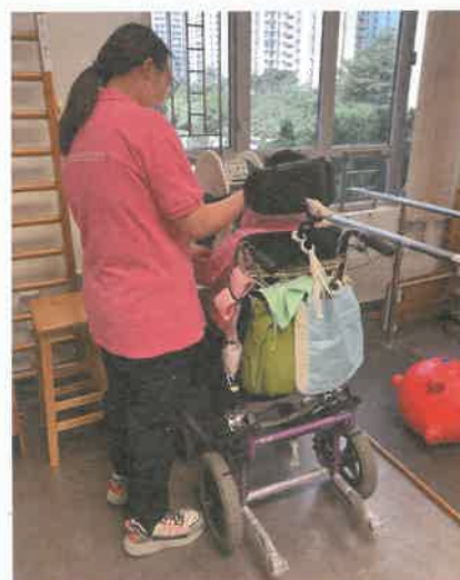
復康工作員正協助會員使用儀器