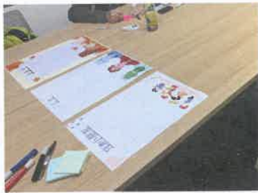
與社區人士的關係，亦是會員需要面對的人際關係。中心定期有義工小組和活動，讓會員思考各類社區人士的需要，並學習如何與他們相處

社工則按會員的能力、表現提供整合性的社交訓練和實踐機會，協助會員更掌握如何應對各人際關係上的情境。同時，透過小組或活動讓會員建立正面的社交經驗，以鼓勵會員可保持社交動機，以及願意與其他人接觸。