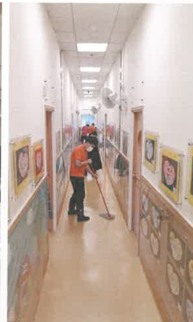
鯉魚門循道衛理幼稚園校園 清潔