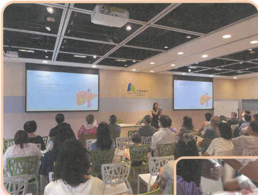
有營健肝健康講座

為改變香港的醫療過往「重治療，輕預防」概念至「重預防」概念，我們開展「為您「家」油·健康社區計劃」，旨在透過多元化的健康介入手法，增加大眾的健康行為、提升對預防疾病及識別健康風險的意識。計劃服務對象為油尖旺區的居民、在職人士及企業。