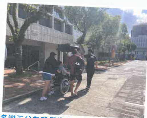
多謝天父為我們準備了陽光充沛的一天，同學們細心地為服務使用者撐傘遮陽