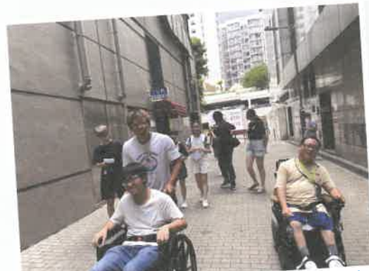
同學們進行輪椅體驗，並由服務使用者分享日常生活的挑戰