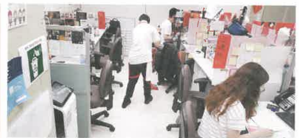
健樂會堂辦公室清潔