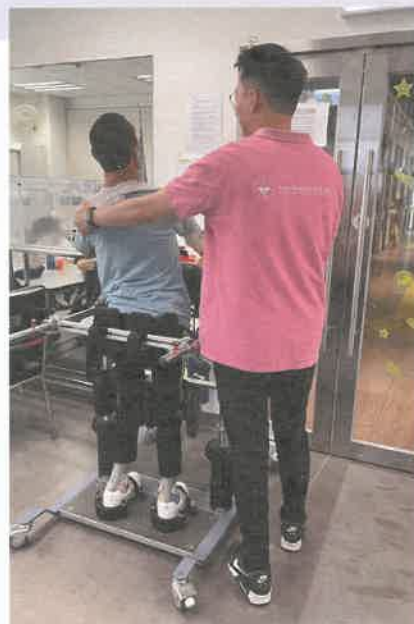
職業治療師因應會員之需要提供合適之服務給會員

由於中心服務對象涵蓋不同年齡層及殘疾類型，服務因此發展十分多元化。中心提供托管服務、日間訓練及嚴重殘疾人士的日間照顧服務（嚴殘服務）等。尤其在嚴殘服務上，會員有不同的需要，因此當中牽涉多個專業及前線同事的配搭。物理治療師、職業治療師、言語治療師、社工及護士會首先評估會員的功能缺損和生活限制，並與會員及家屬溝通，共同制定個人化的復康訓練方案，例如針對會員的身體機能障礙、活動參與受限的情況，並考慮其個人需要和生活環境，設計合適的訓練目標和內容。在訓練實施過程中，各專業人員發揮各自專長，相互配合支持以順利開展訓練，並定期評估進度務求達到預期復康效果。會員、家屬與專業團隊的緊密協作，於嚴殘服務中彰顯出「彼此配搭」的精神。