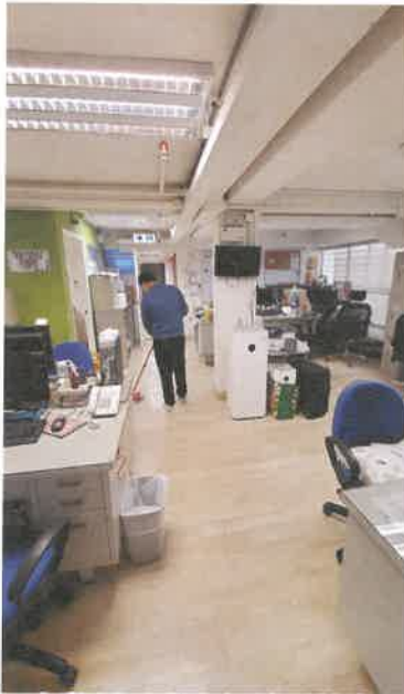
九龍城區青少年外展社會 工作隊辦公室清潔

因此，除了提供模擬工作訓練外，我們亦爭取更切合現實的訓練場景。一直以來，我們透過與機構不同單位接洽，於不同單位內提供清潔訓練、派遞訓練和洗碗訓練等現實的工作訓練場景予會員，好讓會員在工作態度、與人相處、危機應變能得到真實體驗，合作單位提出真實的回應和意見，能讓會員找到進步的方向及改善空間。近年，本中心亦配合會員期望及需要，積極尋找一些有心的商業機構合作，提供辦公室文職及接待等實習及工作機會，讓會員可以有更多就業出路。