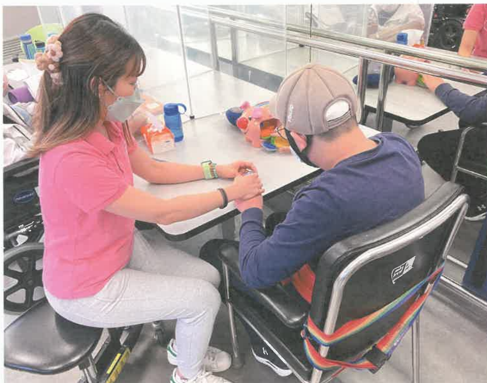
護士定期觀察會員之身體情況