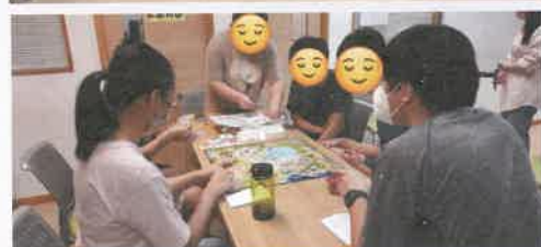
定期舉行社交小組，教授和練習社交技巧，如社交潛規則、開展對話、維持對話等