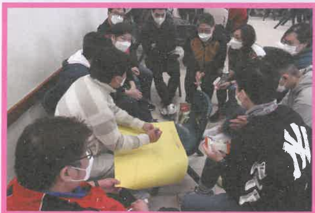
不同職系同事參於全隊會中參與來年年度計劃討論

喜晴計劃是由一個多元專業的團隊組成，當中包括社工、物理治療師、職業治療師、言語治療師、護士、復康工作員、家居照顧員、司機及一眾中心後勤文職支援同工，他們各有不同專業知識及技能。如何讓不同職系的同事組成一個「彼此配搭」的團隊？喜晴計劃一直以來都重視人與人之間的配合，不同職系互助協作、相輔相成，讓這支團隊為服務注入專業精髓，在每個服務中提供全面的支援。