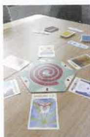
從桌遊活動認識和反思自身的情緒，並學習與其他組員分享感受