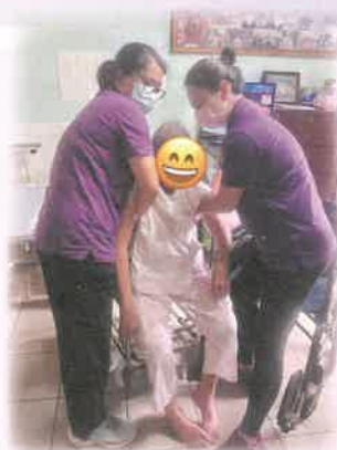
家居照顧員正為服務使用者提供個人照顧服務

除了個人到戶服務外，團隊會舉辦不同社區活動或小組，如照顧者支援活動、大型外出活動、義工活動等。專職同工、非專職同工、義工、服務使用者或照顧者的參與，不論是舉辦者、協助或參與者的角色，大家都可互相配合，這正是「彼此配搭」的真諦。喜晴計劃將繼續相互扶持配合，彰顯出協作的精神，為社區帶來更多溫暖和支持，攜手共創一個彼此關愛的社區。