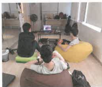
提供機會和平台，讓會員自行討論和實踐與朋友聚會時之活動安排，建立彼此間的關係，亦懂得將此經驗應用於其他關係中