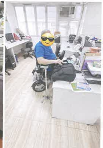
到社企擔當文職工作

因此，除了提供模擬工作訓練外，我們亦爭取更切合現實的訓練場景。一直以來，我們透過與機構不同單位接洽，於不同單位內提供清潔訓練、派遞訓練和洗碗訓練等現實的工作訓練場景予會員，好讓會員在工作態度、與人相處、危機應變能得到真實體驗，合作單位提出真實的回應和意見，能讓會員找到進步的方向及改善空間。近年，本中心亦配合會員期望及需要，積極尋找一些有心的商業機構合作，提供辦公室文職及接待等實習及工作機會，讓會員可以有更多就業出路。