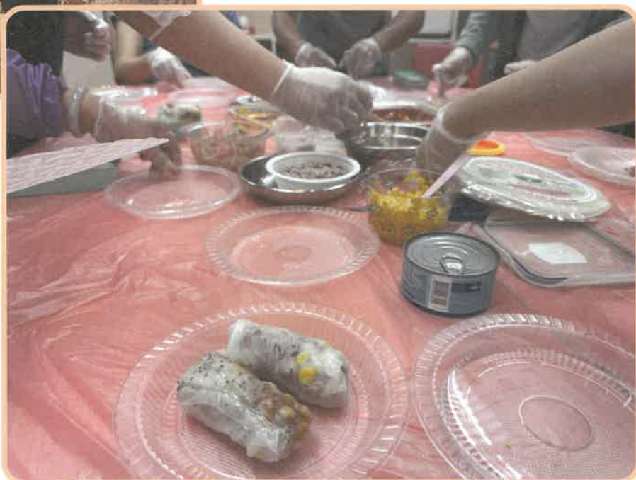
健康生活規劃營養師健康紙米卷班

「為您」這兩個字與循道「衛理」楊震社會服務處的廣州話發音相同，意味著在追求健康的路上，我們將與大家同行，為您「家」油！