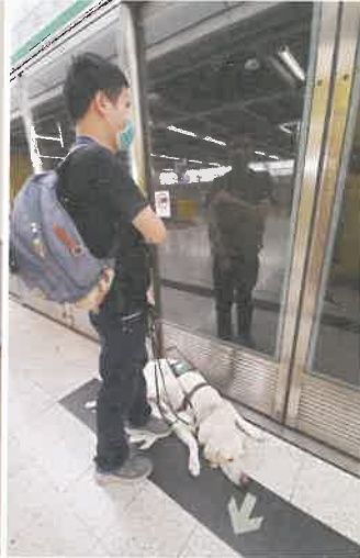
送文件到南山晉逸居