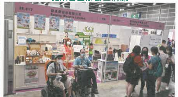
與環保回收公司合辦展銷

中心的職業訓練能獲得各合作單位的配合和商業機構的支持，可以充分發揮彼此配搭的效能，令會員能更容易一步一步的融入社區及為社會增加勞動力，減輕現時部份行業勞動人口不足的情況。