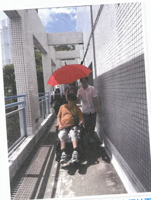
走過各個「秘密通道」，讓大家可以更容易到達校園內的地標

雖然當日天氣炎熱，但大家能在綠草如茵的校園，感受中大的文化氣息，都覺得不枉此行。