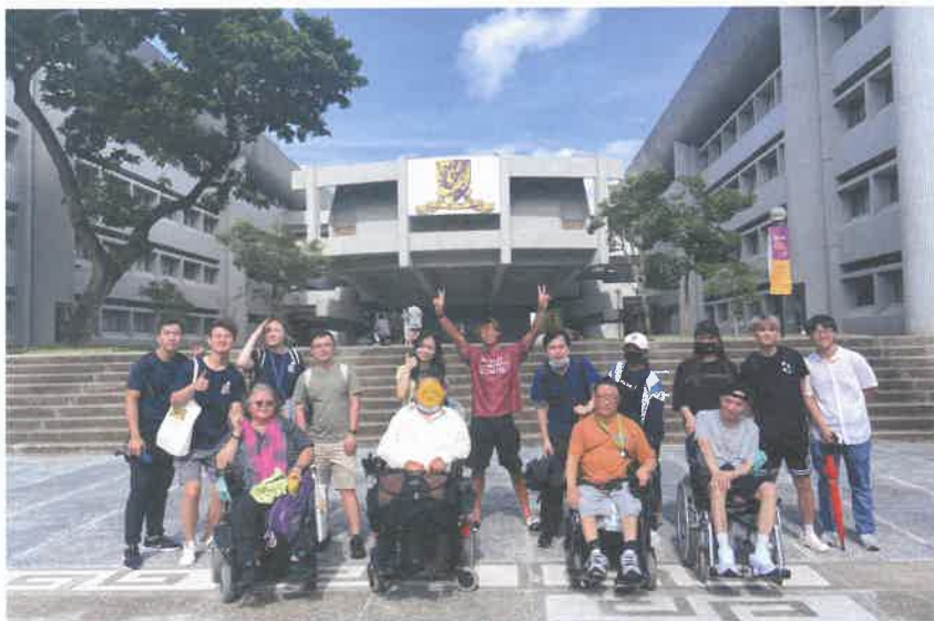
每次電視提到中文大學總會見到的畫面，而今次服務使用者們亦很興奮，第一次於這個地方留影

正所謂「讀萬卷書，不如行萬里路」，親身遊歷總比瀏覽相片更有意義。一直以來，中文大學給人的感覺是一座座的「山城」，眺望吐露港的風景，吸引不少人到校內欣賞風景。但中大山路陡峭，馬路蜿蜒曲折，需要依賴學校巴士才能到達，令傷殘人士難以參觀中大。