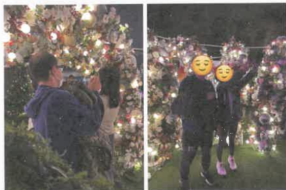
認識關於愛情的理論和知識，並於小組中進行模擬約會，以了解約會時需注意的地方

自閉症人士雖然常常聚焦於自己感興趣的事物上，但不代表他們對其他事物毫不關心，他們只是不太擅長以言語、表情或肢體表達。縱使他們不擅長與人溝通相處，但亦渴望可建立和維繫牢固的人際關係。