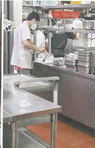
社企一念素食實習