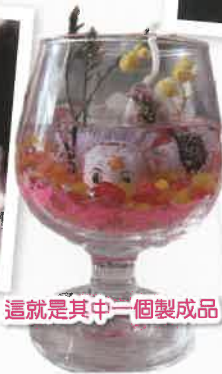
這就是其中一個製成品