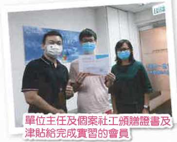
單位主任及個案社工頒贈證書及津貼給完成實習的會員

「職能提升及就業服務」是協助會員投入職場重要的一環，為了鼓勵會員參與工作訓練和實習，中心設立了培訓津貼。當會員實習滿了時數後，經過部門主管的審批，便能獲得證書及津貼，以肯定其努力與能力。看到會員逐漸進步，更展示自信及滿足的笑容，我們亦為他感到驕傲！