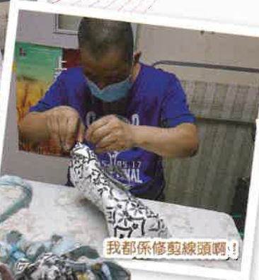
我都係修剪線頭嘍!