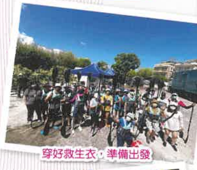
穿好救生衣，準備出發

工場方面，今年度舉辦了親子瑜珈班、獨木舟一日遊及坪州藝術慢遊予家長及會員，讓會員有機會挑戰自己，培養運動習慣及與家長共渡悠閒時光。宿舍方面，亦與家長一同製作擴香石及驅蚊香油，藉著香氣一同減壓。歡迎各位家長提供活動建議！