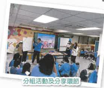
分組活動及分享環節