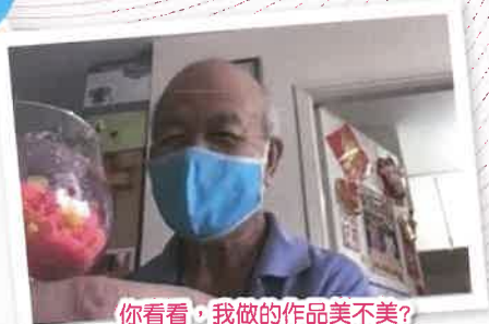
你看看，我做的作品美不美？

透過4節靜觀活動，讓服務使用者及照顧者舒緩生活壓力，多點聆聽內心的需要；藉著彼此分享及鼓勵，讓參加者感受到同路人的支持，為生活加多點點色彩