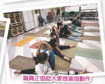
職員正協助大家做瑜伽動作