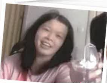
你看我笑得多開心就知道活動很好玩