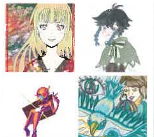
「平板電腦繪畫同好會」會員的作品