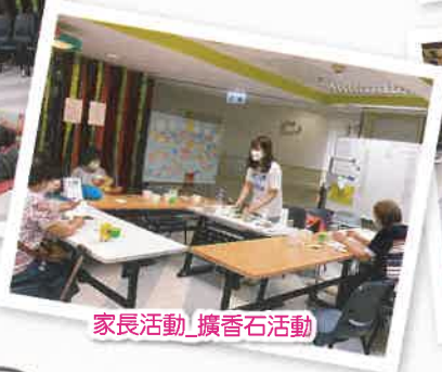
家長活動_擴香石活動