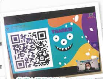
教育心理學家進行ZOOM講座