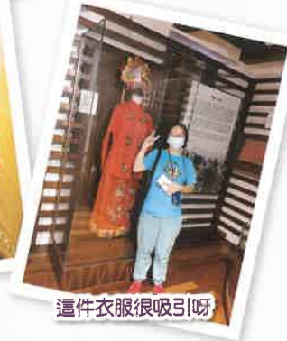
這件衣服很吸引呀