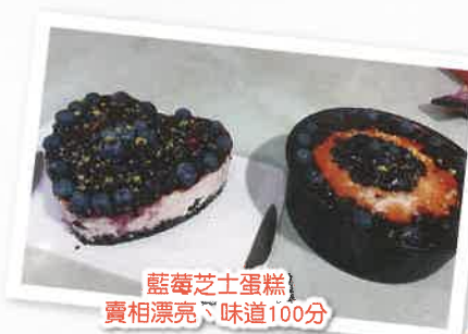
藍莓芝士蛋糕 賣相漂亮、味道100分

適逢秋冬將至，宿舍舉辦不同的興趣活動予舍友參加，舍友們能體驗製作精美和設計獨一無二的中秋燈籠，享受製作做手作的過程。完成作品後一起掛上手繪燈籠以裝飾宿舍，當亮起燈光時便形成一個漂亮的花燈海，舍友們都紛紛熱烈來進行打卡與家人分享感受，加強舍友們之間的聯繫並體現中秋節團圓的氣氛。除此以外，宿舍還舉辦了「滑滑豆腐花」、「奶皇冰皮月餅」和「藍莓芝士蛋糕」活動，舍友們在廚藝方面亦很有潛能，親手製作食品的賣相和味道都非常吸引，他們能從中獲得成功感，學員還能將親手製作的月餅送給親友，共同分享喜悅，大家在整個初秋都能感到和諧與溫馨。