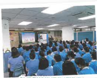
社工到校進行教師講座

社工、高級特殊幼兒導師及教育心理學家會支援教師課室管理、識別校內潛在個案，為教師提供專業性策略，亦會為教師提供各專題的教師培訓及講座，增加教師對支援特殊學習需要學童的知識及技巧。早苗計劃的治療師及特殊幼兒導師亦會定期與主任、老師會面，彼此交流緊貼學生情況，為幼兒作出最適切的支援。