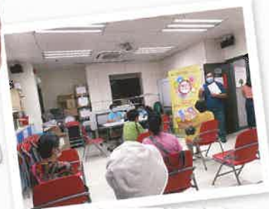
大家都很用心在上課