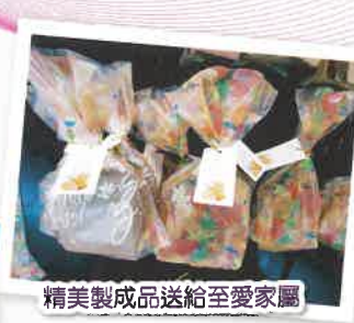
精美製成品送給至愛家屬