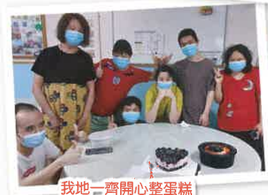
我地一齊開心整蛋糕