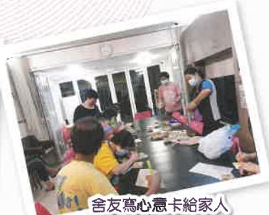
舍友寫心意卡給家人