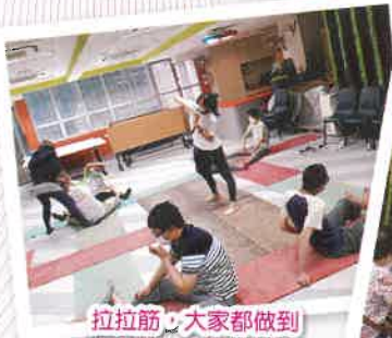
拉拉筋，大家都做到