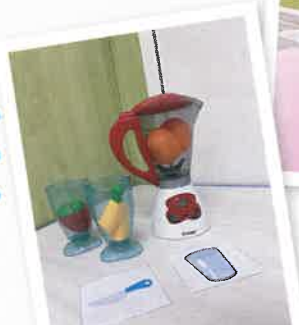
言語治療師透過視覺提示引導學童表達

果汁健康又美味，很多小朋友都喜歡！跨專業密集式訓練課程中的言語社交小組於10月份以「整果汁」為主題進行活動。在製作果汁的過程中，學童以言語或手勢表達，揀選自己喜愛的水果。治療師又營造了不同情境，引導他們在社交情境中進行解難。學童在小組中製作了不同款式的果汁，完成後還和大家一起分享！