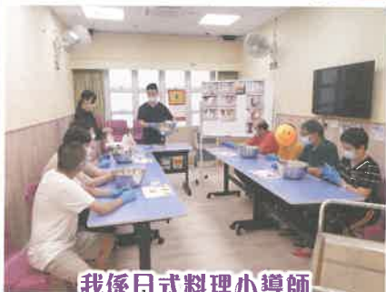
我係日式料理小導師