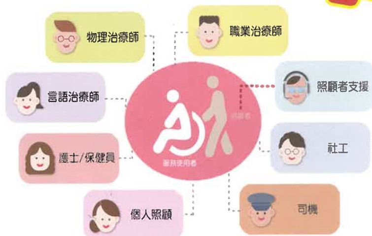
圖1：喜晴計劃專業服務團隊

喜晴計劃自2014年起，為居住於九龍城、深水埗、油尖旺及將軍澳區內合資格的殘疾人士提供家居照顧服務，透過一系列的綜合到戶服務，滿足在社區居住的殘疾人士的需要，減輕其家屬／照顧者的壓力，改善他們的生活質素，支援他們在社區生活，並同時為其家屬／照顧者提供訓練及支援，以提升他們的照顧能力。至今八載，團隊已發展成過百人的大家庭，主要職系有社工、物理治療師、職業治療師、護士、復康工作員及家居照顧員，於2021年起更加入言語治療師及司機，讓服務更全面地支援殘疾人士所面對的需要（圖1）。