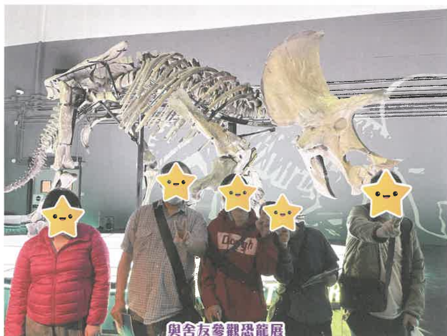
與舍友參觀恐龍展