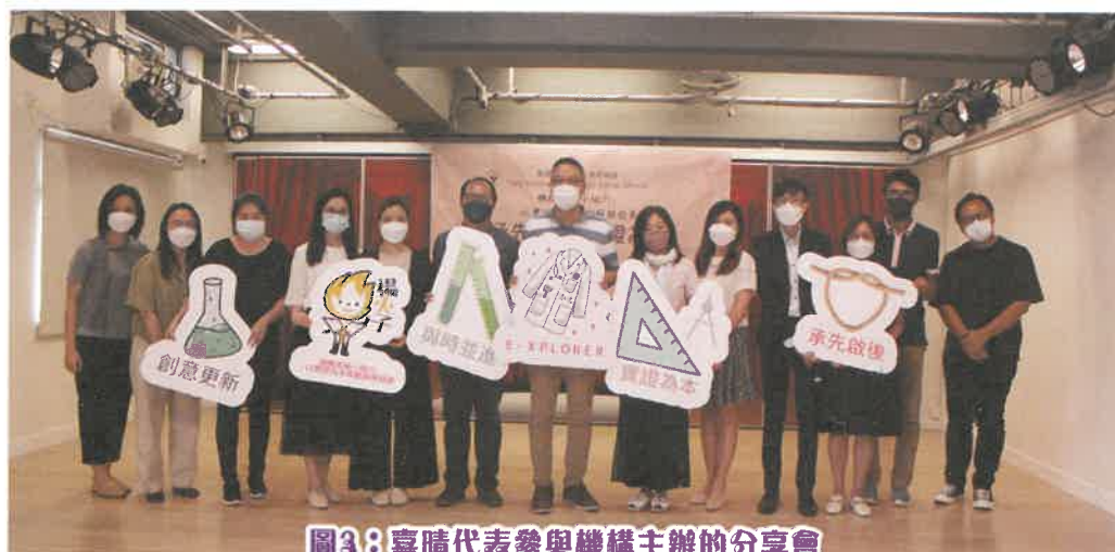
圖3：喜晴代表參與機構主辦的分享會

(資料來源：世界衛生組織網頁 https://www.who.int/classifications/international-classification-of-functioning-disability-and-health )