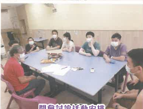
開會討論活動安排