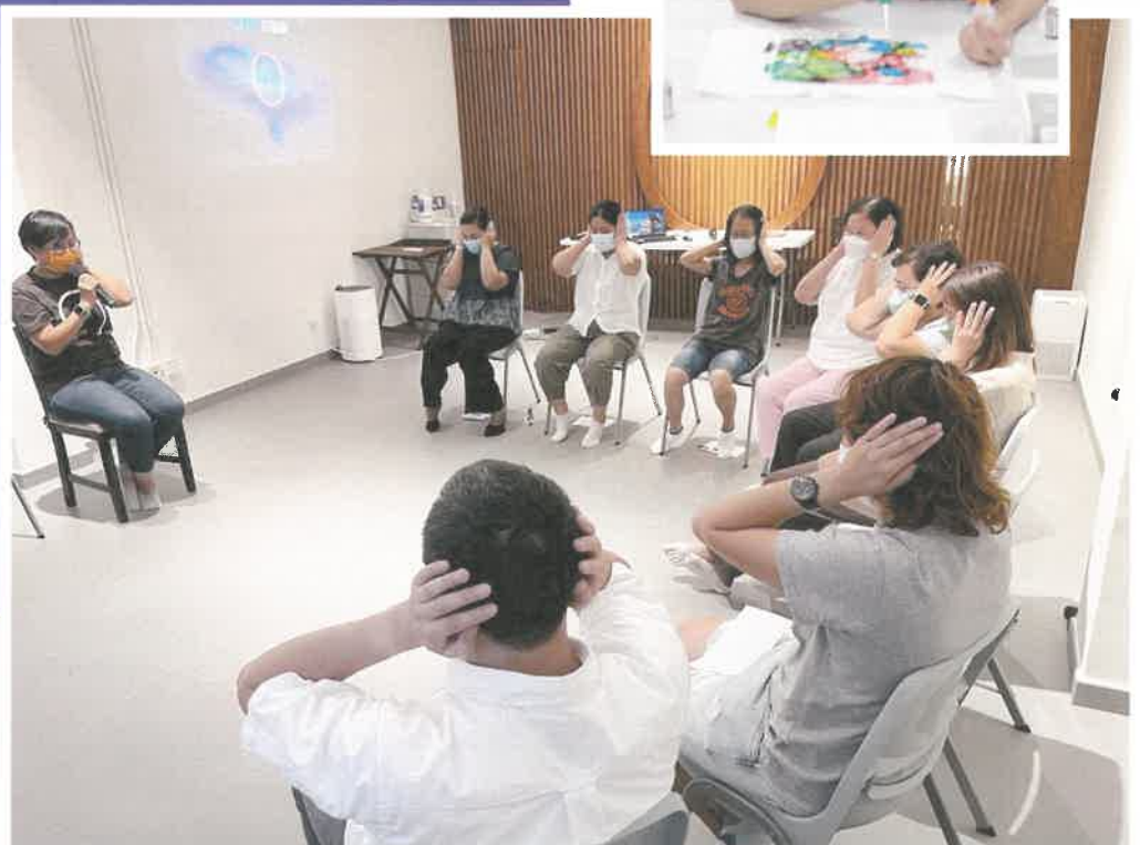
深油生活 照顧者計劃