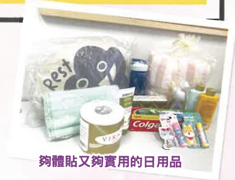
夠體貼又夠實用的日用品