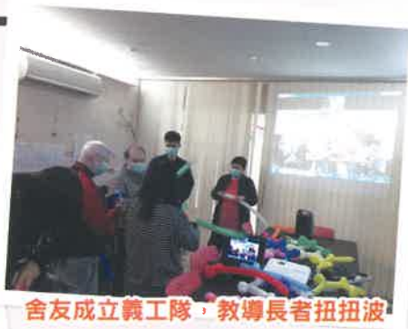
舍友成立義工隊，教導長者扭扭波