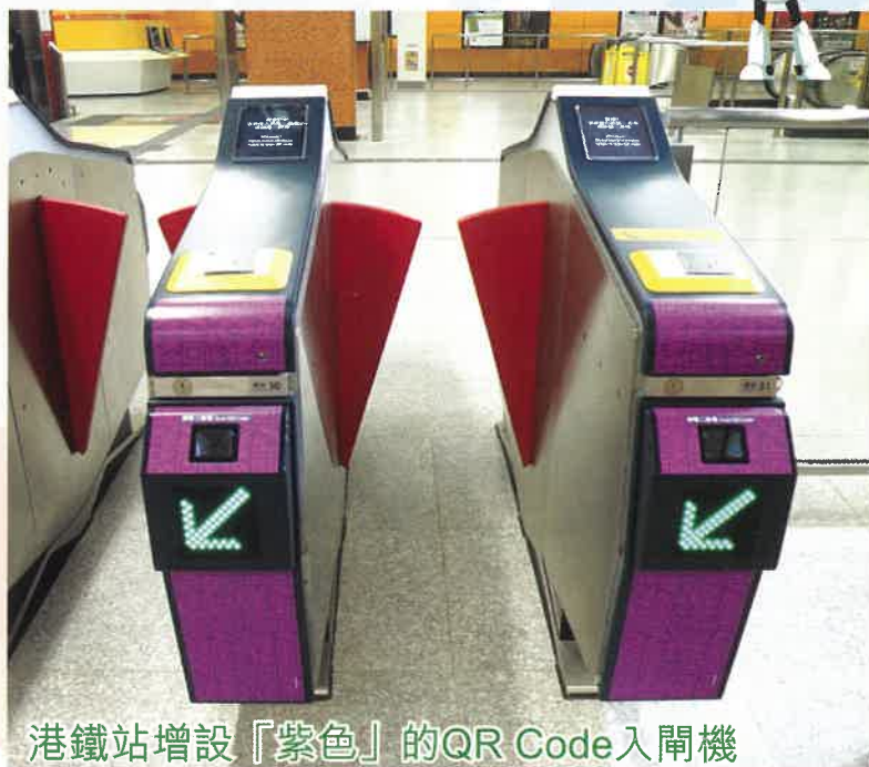
港鐵站增設「紫色」的QR Code入閘機

手機利用QR Code直接入閘搭港鐵已於1月23日正式啟動！現在可使用MTR Mobile綁定AlipayHK及揀選港鐵的「我的車票」，或使用AlipayHK的易乘碼（EasyGo）使用二維碼乘車服務。港鐵全部93個車站（機場快綫車站除外），於每一排閘機均會設置最少兩部閘機可提供二維碼付費乘車服務，並且會包上紫色顯眼標示。以後過閘有了新選擇，一掃便能起行！