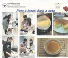
日式輕芝士蛋糕製作