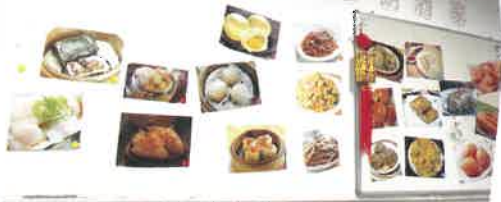
「晉朗酒家」提供了各式各樣的點心予舍友選擇。