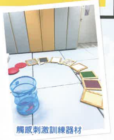
觸感刺激訓練器材