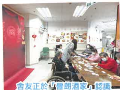
舍友正於「晉朗酒家」認識不同點心的款式。