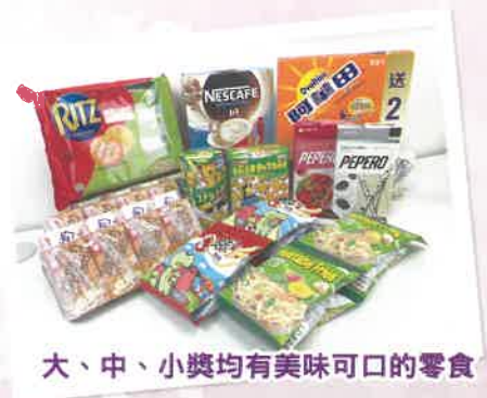
大、中、小獎均有美味可口的零食