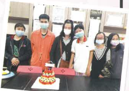
生日派對活動，一起吃生日蛋糕

單位成立了義工隊，跟區內的長者進行共融活動，在新春佳節，透過用ZOOM形式，教授長者學習扭扭波，大家一起扭出不同形狀的動物或物品，突然『拍』的一聲，一個氣球爆破了……大家充滿歡笑聲！