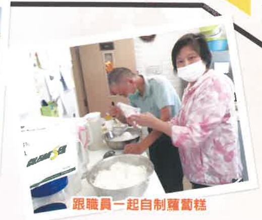
跟職員一起自制蘿蔔糕