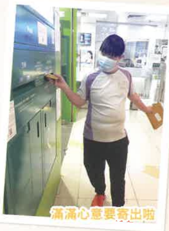
滿滿心意要寄出啦