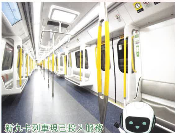
新九卡列車現已投入服務

除了QR Code入閘機，港鐵同時新增了東鐵綫九卡列車，以配合港島區新鐵路路段的空間限制下營運需要。九卡列車投入服務後，東鐵綫的十二卡列車將會陸續被更換。新九卡列車的車廂比現有列車車廂稍闊，車廂內的設備亦經過改良，以提供更寬敞舒適的乘車環境。新列車設有動態路線圖及車卡連接通道顯示屏，方便乘客於旅途中掌握更多資訊。