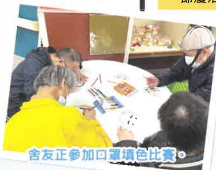
舍友正參加口罩填色比賽。