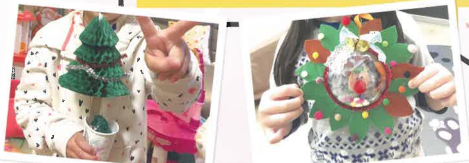
家長和學童一同製作禮物包內的小手工，作品精緻。

疫情快將接近一年，在這普天同慶的聖誕節，為了讓家長和學童感受節日的氣氛，早苗計劃特意準備了聖誕禮物包和防疫物資，透過速遞送到學童手上，讓家長和學童在家抗疫，也能感受我們的關懷，共享快樂聖誕。