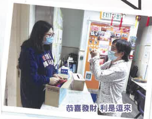
恭喜發財 利是逗來