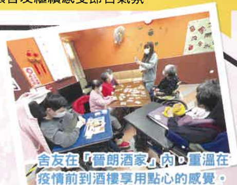
舍友在「晉朗酒家」內，重溫在疫情前到酒樓享用點心的感覺。