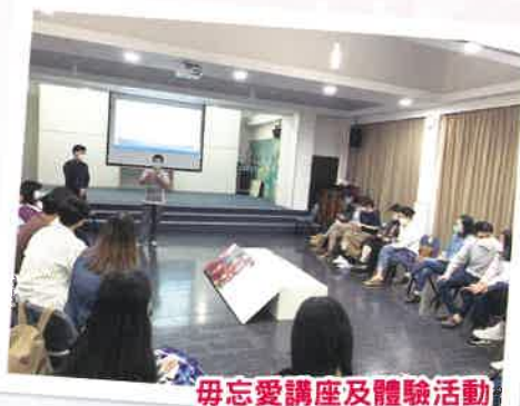
毋忘愛講座及體驗活動