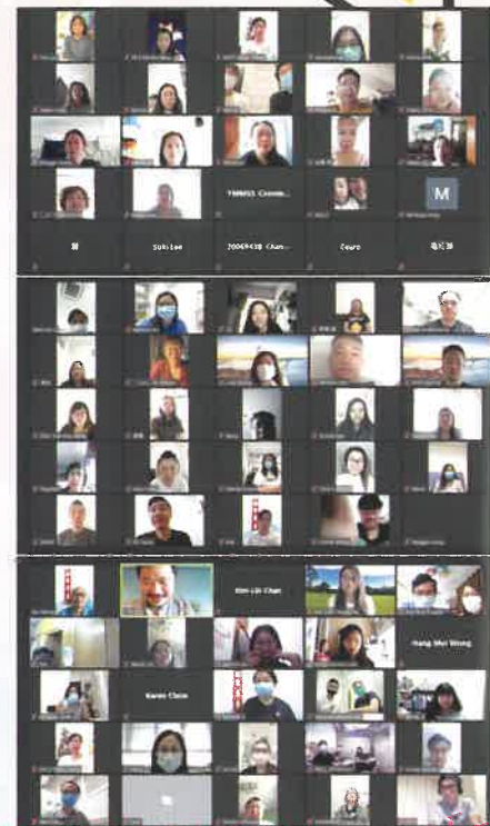
網上「預設醫療指示及在家離世」培訓工作坊