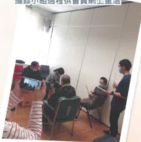
攝錄小組過程供會員網上重溫