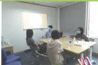
星星孩子家長工作坊