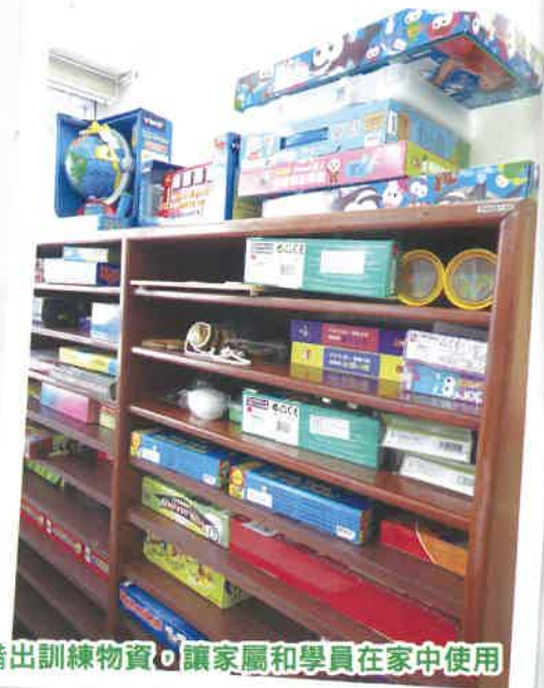
中心借出訓練物資，讓家屬和學員在家中使用

中心看見此情況，希望學員在家亦能夠接受一些訓練，故此向家屬了解意願後，安排進行視像訓練，與及借出一些教材，讓家屬陪同學員在家中使用。希望能讓學員在家亦能「停課不停學」。