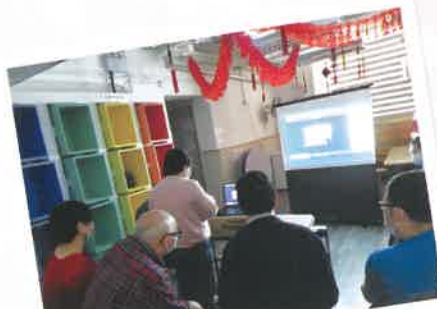
用ZOOM跟友好單位拜年，祝大家身體健康