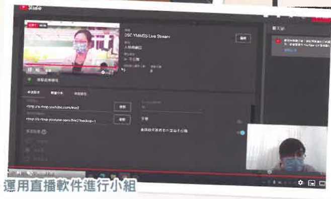
運用直播軟件進行小組

中心使用網上直播形式進行小組活動 疫情期間不少會員都留在家中避疫而減少到中心，為了讓他們在這段期間繼續能參與各類型小組，保持與中心的聯繫，中心近月開始以網上直播形式進行小組，讓會員在家中避疫時亦能繼續參與小組。而未能即時參與直播的會員亦能在稍後時間觀看視像重溫。此外，為加強與會員及家屬的聯繫，中心亦建立了Whatsapp通訊渠道，使中心聯絡和發放資訊的工作更加便利和快捷。