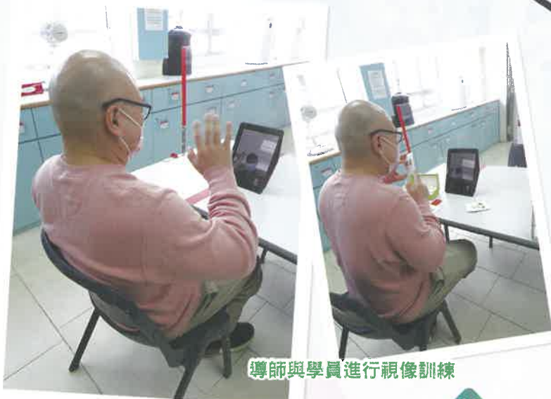
導師與學員進行視像訓練