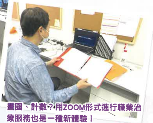
畫圈、計數?用ZOOM形式進行職業治療服務也是一種新體驗!