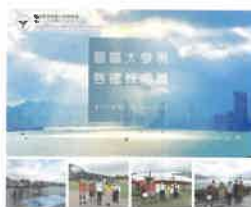
區區大發現—啟德郵輪碼頭參觀