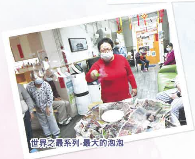
世界之最系列-最大的泡泡