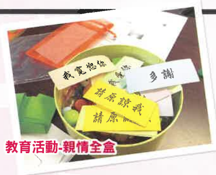
教育活動-親情全盒