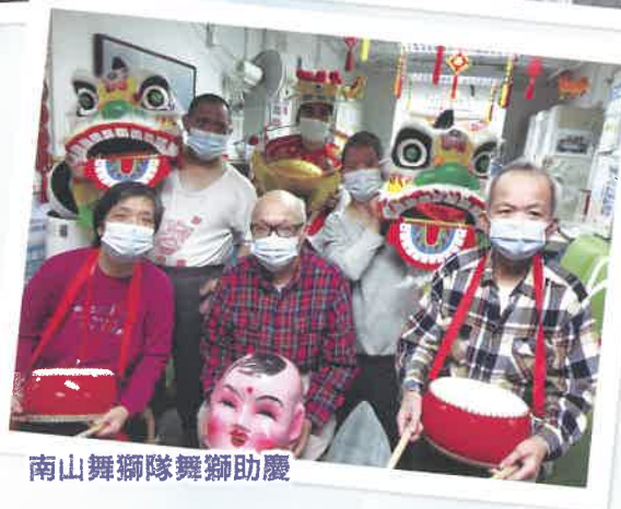
南山舞獅隊舞獅助慶