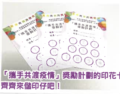
「攜手共渡疫情」獎勵計劃的印花卡，齊齊來儲印仔吧！