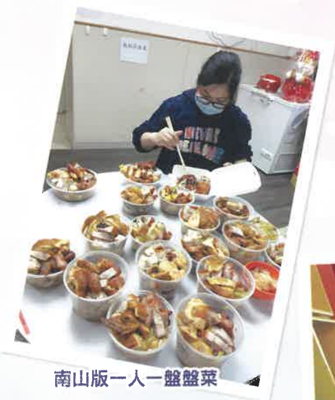
南山版一人一盤盤菜

新年宿舍活動真係多，舞獅、泡泡好好玩，盤菜人人有份食，舍友抱肚叫飽飽；初二開年有舞獅，仲有親朋好友視訊來拜年。恭喜發財！利是逗來！舍友日日有利是，祝福新一年人人大吉大利！