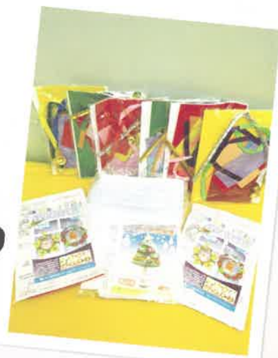
中心向學童及家長派發聖誕禮物包