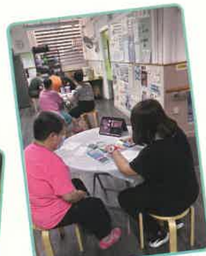
▲認真聽義工講解點畫畫