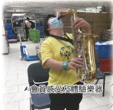
▲會員感受及體驗樂器