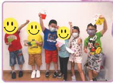
▲導師和我們一起做了漂亮的杯子蛋糕！

暑假期間，正當一眾家長惆悵如何與學童渡過漫長的暑假，早苗計劃的跨專業團隊已為早苗計劃學童策劃了一系列的暑期密集訓練班，由特殊幼兒導師、言語治療師、職業治療師及物理治療師以六大學習範疇為訓練綱領，設計了一系列有趣好玩的活動，令學童於暑期能接受持續訓練，渡過了一個充實的暑期！