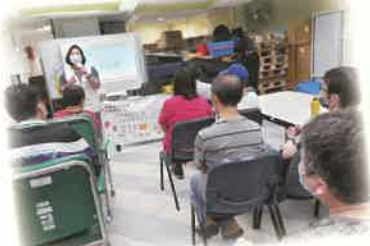
▲紅十字會職員教授急救知識