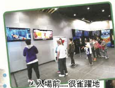
▲入場前.....很雀躍地欣賞預告片