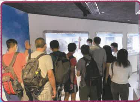
▲參觀中大氣候變化博物館

此外，為鼓勵會員多做運動鬆一鬆，中心的職業治療師和社工身體力行，與會員一起進行體適能小組，透過簡單運動及伸展動作鍛鍊體能。在職能提升方面，會員在中心進行職能訓練之餘，我們亦鼓勵他們接觸各行各業，如帶領參加者出席招聘會，累積求職實戰經驗，逐步提升自信心。