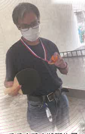
▲乒乓金牌小將誕生了！！

不論是手捧著獎牌還是畫作，親身體驗到運動的魅力及藝術的療癒感已讓學員感到大大的滿足呢！