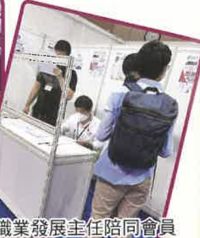
▲職業發展主任陪同會員出席勞工處招聘會