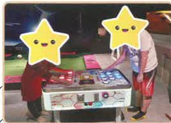
▲室內遊樂園，互相競技一番