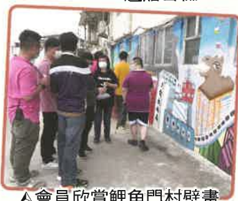
▲會員欣賞鯉魚門村壁畫