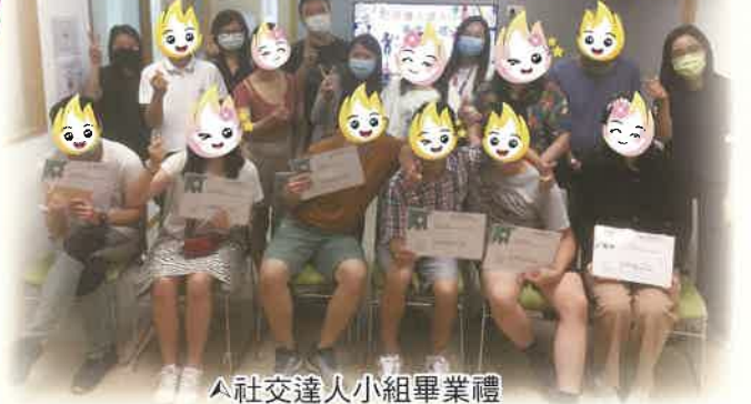
▲社交達人小組畢業禮