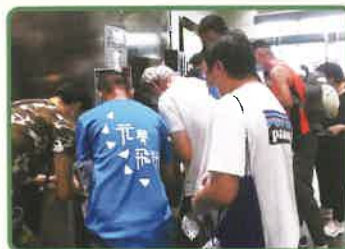
▲睇戲前.....先要登記個人資料

整個過程，舍友感到心情愉快，因為好久都沒出外活動，今次既可舒展身心，同時亦可與大家一齊歡聚一個上午；有舍友還表示看電影就嘗過很多次，但自己購票就真的是第一次，故有一個很深刻的印象，今次能學習到如何購買戲票。