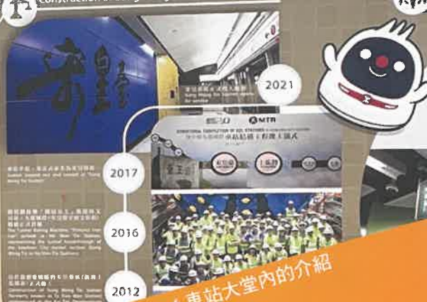
車站大堂內的介紹