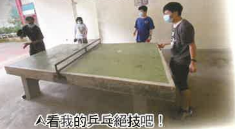
▲看我的乒乓絕技吧！