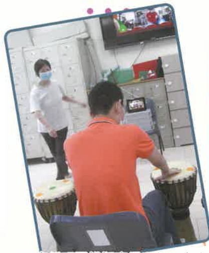
▲原來係玩緊模擬實景啲打地鼠遊戲呀！

其實…我哋係做緊運動㗎！我哋利用電子平板配合應用程式，讓學員可以模擬實景咁玩遊戲！學員從進行「打地鼠」遊戲中，開心投入咁進行運動，訓練手眼協調同郁動吓身體啦！