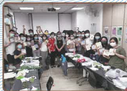
▲園藝治療培訓工作坊