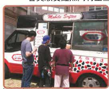
▲會員等候取雪糕杯