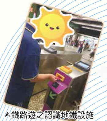
▲鐵路遊之認識地鐵設施