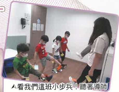
▲看我們這班小步兵！聽著導師的指令舉起顏色旗呢！