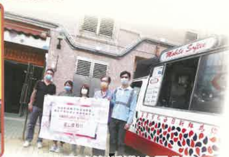
▲中國建築(香港)有限公司送贈雪糕