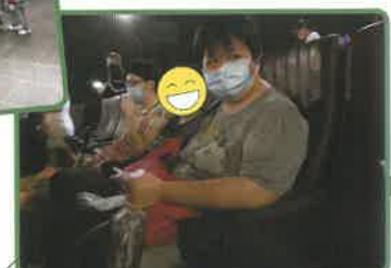
▲期望已久----終於入場啦.....等待睇戲，既緊張又興奮！！