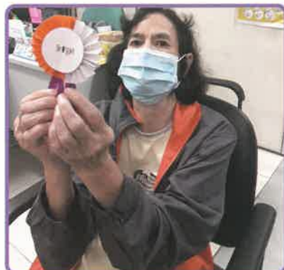
▲參考「四道人生」的概念，藉小手工鼓勵學員向身邊人致謝