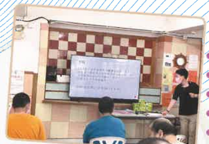
▲與舍友開展的減重計劃啟動了