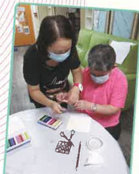
▲朋友！俾我幫下你啦

2021年7月15日，宿舍首次以zoom形式進行共融活動，是次活動有5位舍友與10位英華書院的學生參與，以網上連線的方式進行和諧粉彩，舍友們在協助下完成自己的畫作。活動後，舍友仍與義工進行交流，以增進彼此認識。