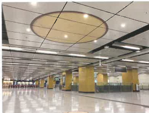
乘客可透過車站大堂天花的透明底板，觀看其中一個古井

宋皇臺站坐落九龍城區，在建造宋皇臺站期間，有大量宋元古蹟出土，站內設計亦揉合大量考古元素，而閘內亦有兩個主題展櫃，成為車站的一大特色。大家空閒時可以到站參觀一下。