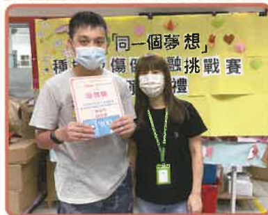
▲中心舉辦同一個夢想頒獎禮

感謝中國建築(香港)有限公司於8月份捐贈富豪雪糕杯予會員，讓會員於炎夏一嘗透心涼的感覺，會員都感到非常高興，在此再次代表會員衷心感謝中國建築(香港)有限公司的熱心及愛心！