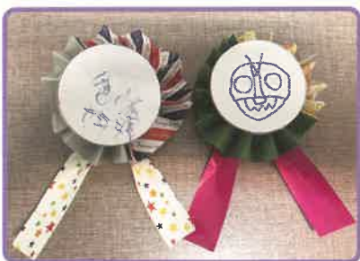
▲參考「四道人生」的概念，藉小手工鼓勵學員向身邊人致謝

在疫情籠罩下，生病、死亡變得咫尺之近，晉業中心與老齡化小組學員一同探討善終、善別，從而反思生命，建立正面人生觀。