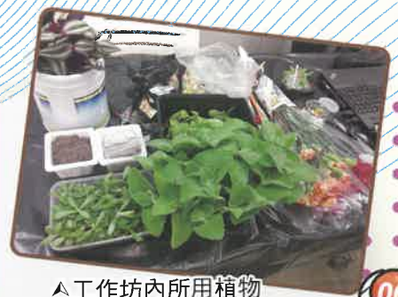
▲工作坊內所用植物