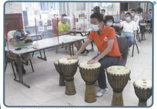
▲學員拍緊非洲鼓，唔通係表演緊？