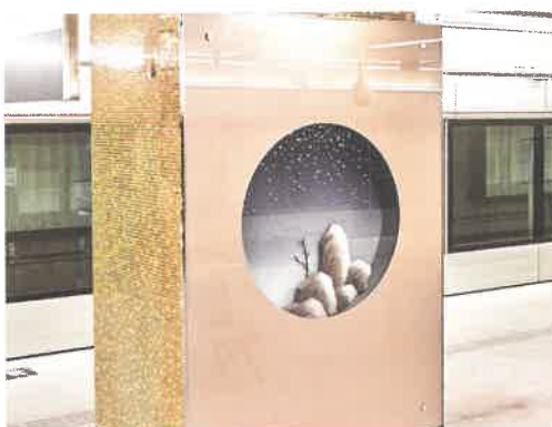
位於車站月台的藝術品《大地陶詞》