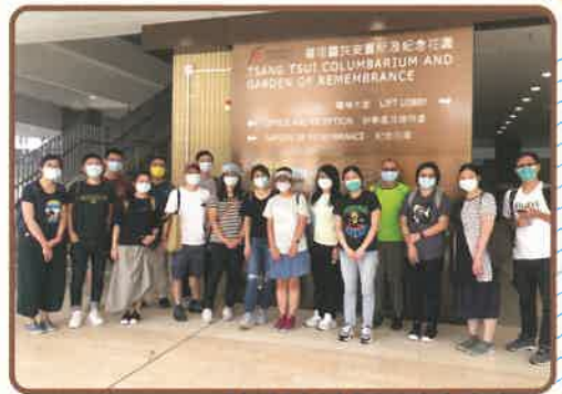
▲參觀屯門曾咀靈灰安置所及紀念花園