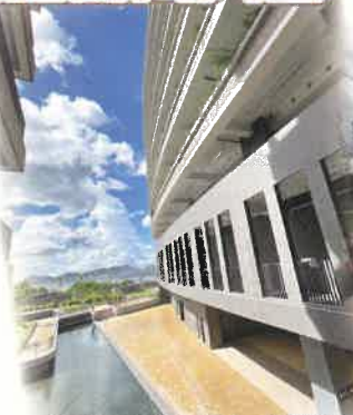
▲新建成之靈灰安置所

新落成的屯門曾咀靈灰安置所及紀念花園為食環署轄下最大的紀念花園，園內設計力求與自然環境融合。同工們參觀後了解到本地擺放撒放骨灰及綠色殯葬情況。另外，園藝治療培訓工作坊亦是利用大自然元素，了解生命循環與生命教育之關係。單位同工於參觀及培訓後會推出不同安寧照顧服務相關活動。計劃內容請留意往後出版的「圓途有您」計劃季刊呢！