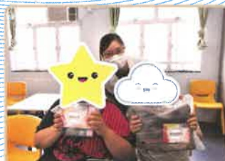
▲《年度獎勵計劃》— 舍友收到表揚禮物均表示非常喜愛